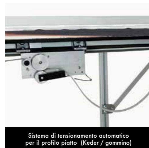
Sistema di tensionamento automatico per il profilo piatto (Keder / gommino)