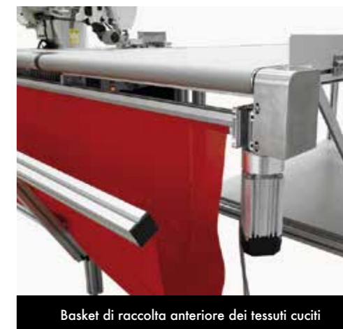
Basket di raccolta anteriore dei tessuti cuciti