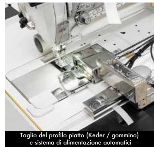
Taglio del profilo piatto (Keder / gommino) e sistema di alimentazione automatici

CRONOS utilizza solo 4 mq di spazio di lavoro, consentendo di adattarsi a laboratori di qualsiasi dimensione.