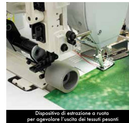
Dispositivo di estrazione a ruota per agevolare l'uscita dei tessuti pesanti