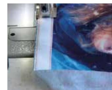
Velcro® / Nastro