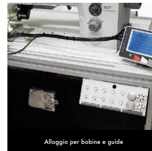
Alloggio per bobine e guide