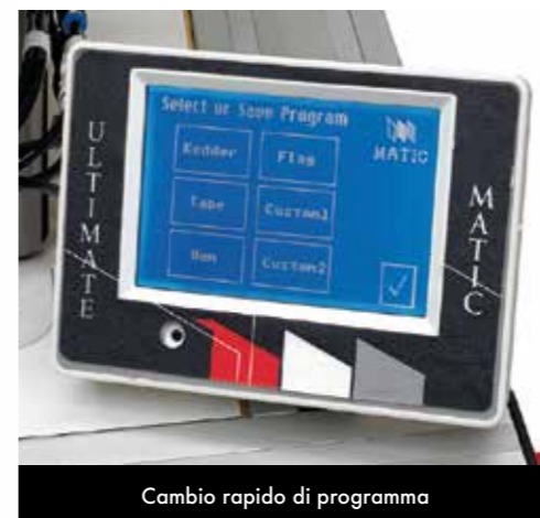
Cambio rapido di programma