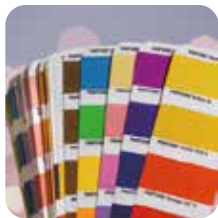
Cartella colori stampa digitale Gestione del colore digitale one-stop Coerenza e stabilità della resa cromatica