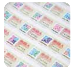
Stampa di codici a barre e codici QR Facile funzionamento di vari tipi di ordini Maggiori opportunità di business