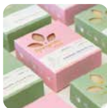
Stampa in scala di grigi Immagini colorate Progettazione di imballaggi personalizzati