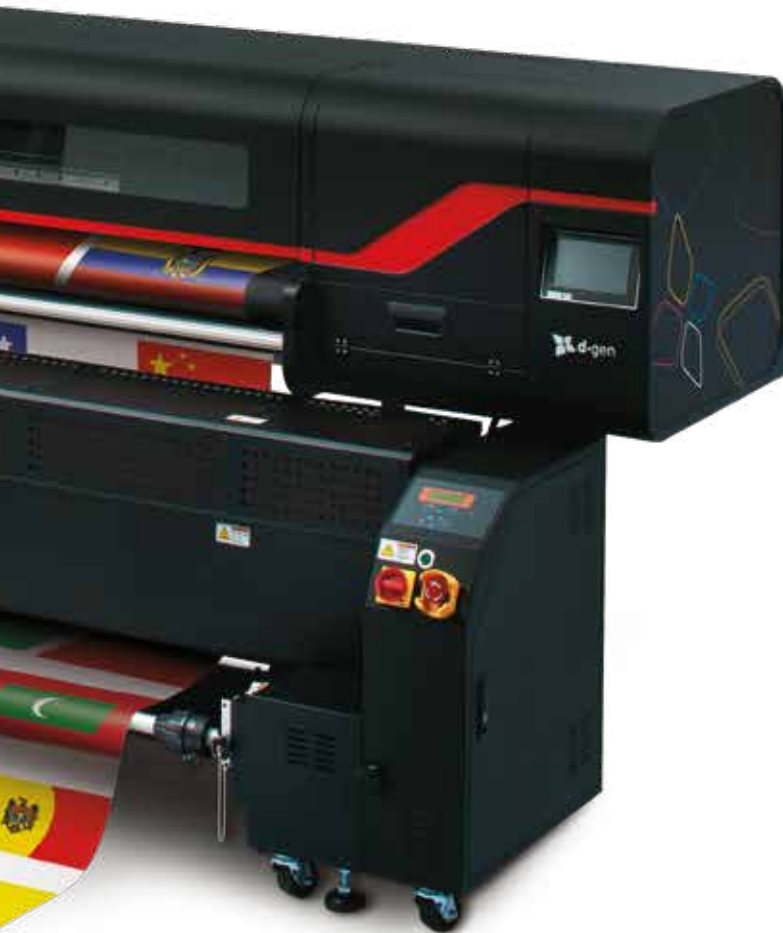
Velocità di stampa (m 2 /h)